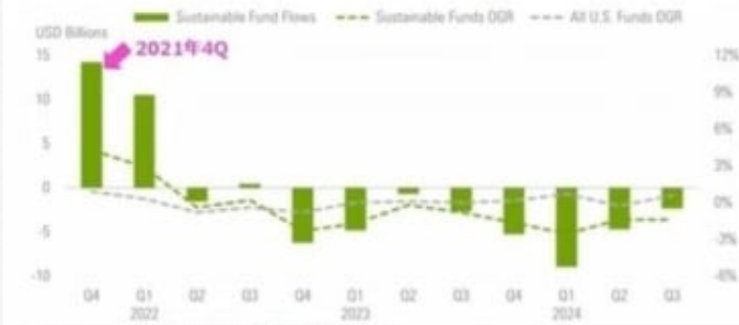
Exhibit 1 US Fund Flows: ESG Vs. All US Funds (USD Billion)