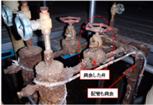
重原油A系列圧力検出配管および弁