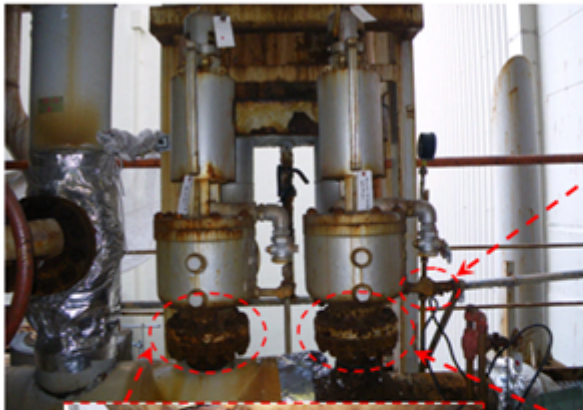
スチームコンバータバイパス管安全弁