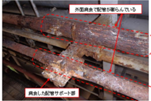
トレース蒸気配管