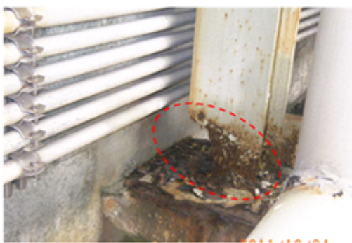
循環水ポンプ点検架台 台座部鋼材の腐食